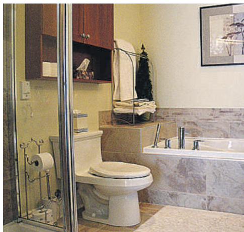
Bain, douche à porte vitrée et robinetterie de luxe dans la salle de bain.

Un appartement à Villagia, c'est d'abord un lieu lumineux et raffiné. La porte-fenêtre du séjour donne sur le balcon et fait partie littéralement d'un mur fenêtre qui laisse abondamment pénétrer la lumière naturelle. Du plancher au plafond, rien ne vient l'obstruer, même pas un calorifère.