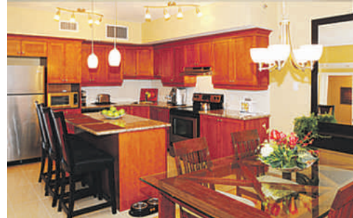
Les appartements plus luxueux bénéficient de comptoirs en granit, de planchers de bois et céramique ainsi que de la climatisation centrale.