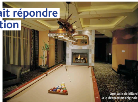
Une salle de billard à la décoration originale