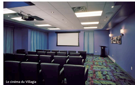
Le cinéma du Villagia

à acheter, mais qui n'ont pas encore vendu leur résidence, Villagia offre une formule facilitant la réalisation de leur rêve et ainsi leur permet de jouir le plus tôt possible de leur nouvelle vie, soit un prêt intérimaire à faible taux. Celui-ci leur donne la possibilité d'attendre sans